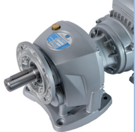
Robus - A2, il recente riduttore coassiale che completa la gamma Robus.