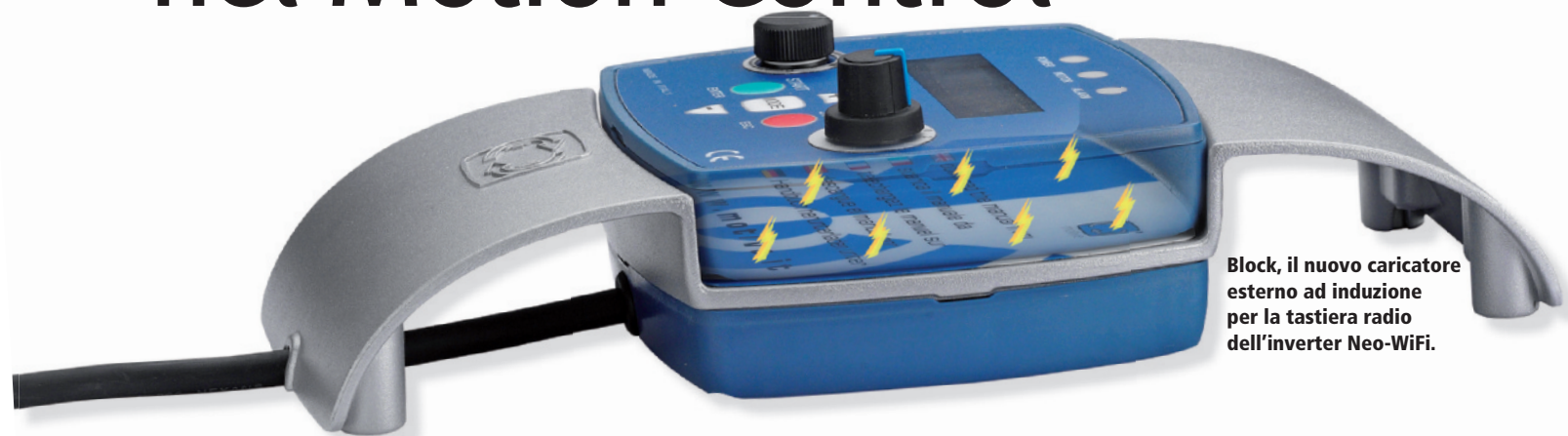
Block, il nuovo caricatore esterno ad induzione per la tastiera radio dell'inverter Neo-WiFi.

Motive arricchisce la gamma dei suoi prodotti con tre novità: un ricaricatore esterno ad induzione per la tastiera radio dell'inverter Neo-WiFi; un riduttore coassiale a completamento della gamma e con un nuovo raddrizzatore per i motori autofrenanti.